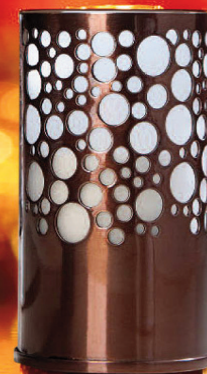
LAMPE ART DÉCO